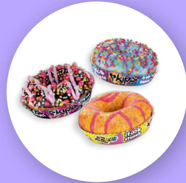
3 smaki donutów z firmą Dotti Donuts (nowy smak we współpracy z projektem Genzie)