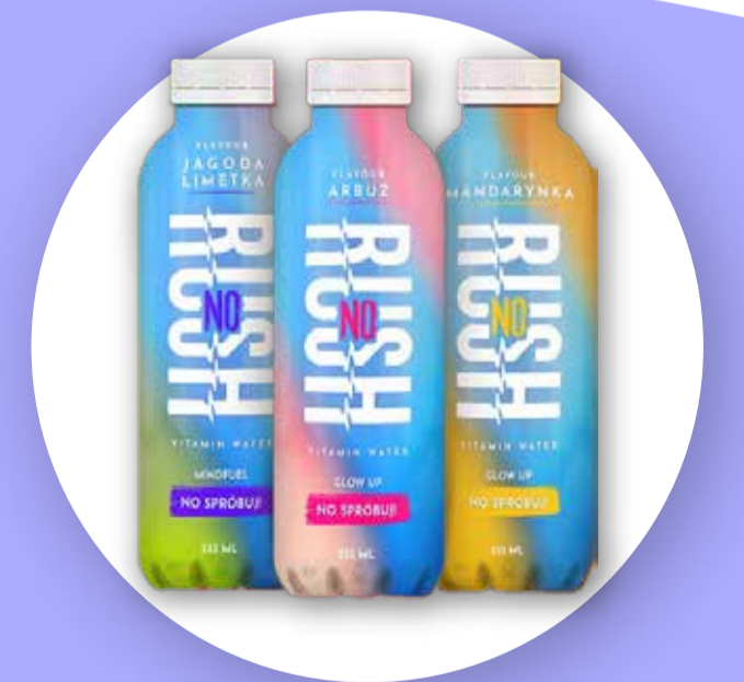
Woda witaminowa noRush