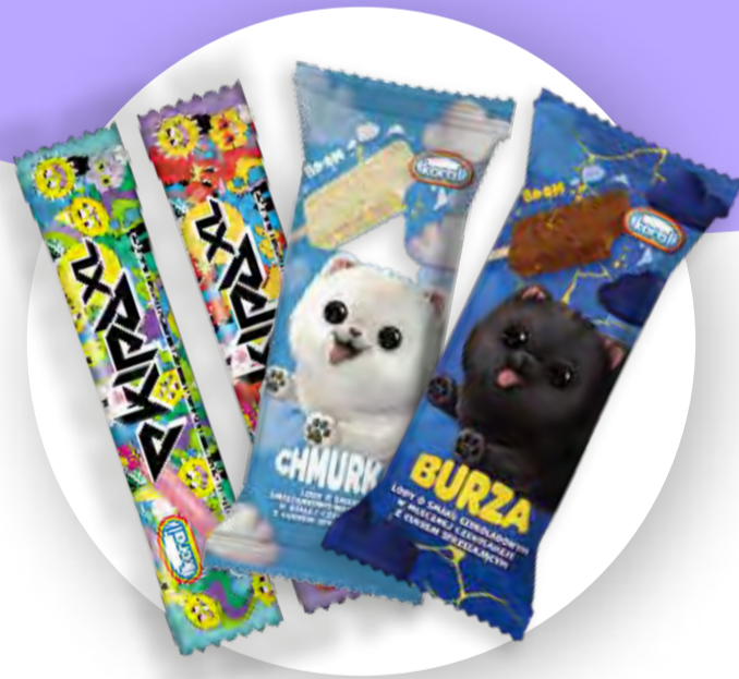
7 smaków lodów z firmą Koral