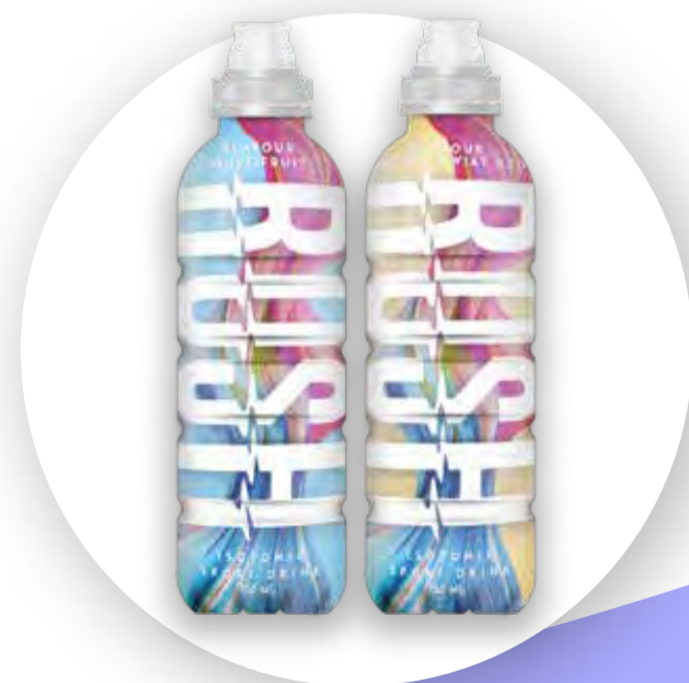
Napój izotoniczny Rush