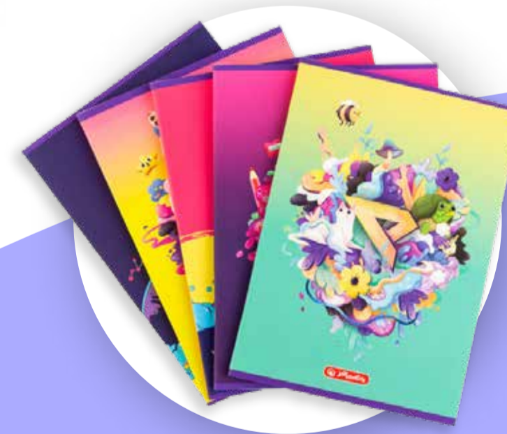
Mix artykułów szkolnych z firmą Herlitz