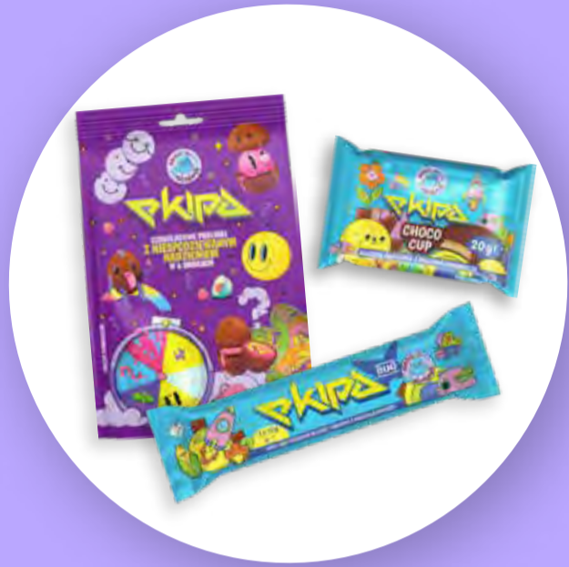
Czekoladowe Choco Cup'y, Batoniki i challenge-owe praliny o sześciu smakach z firmą Milano