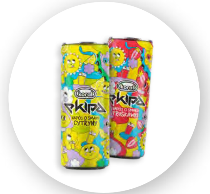
2 smaki napojów z firmą Koral