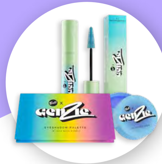
Zestaw kosmetyków do makijażu GenZie z firmą Bell