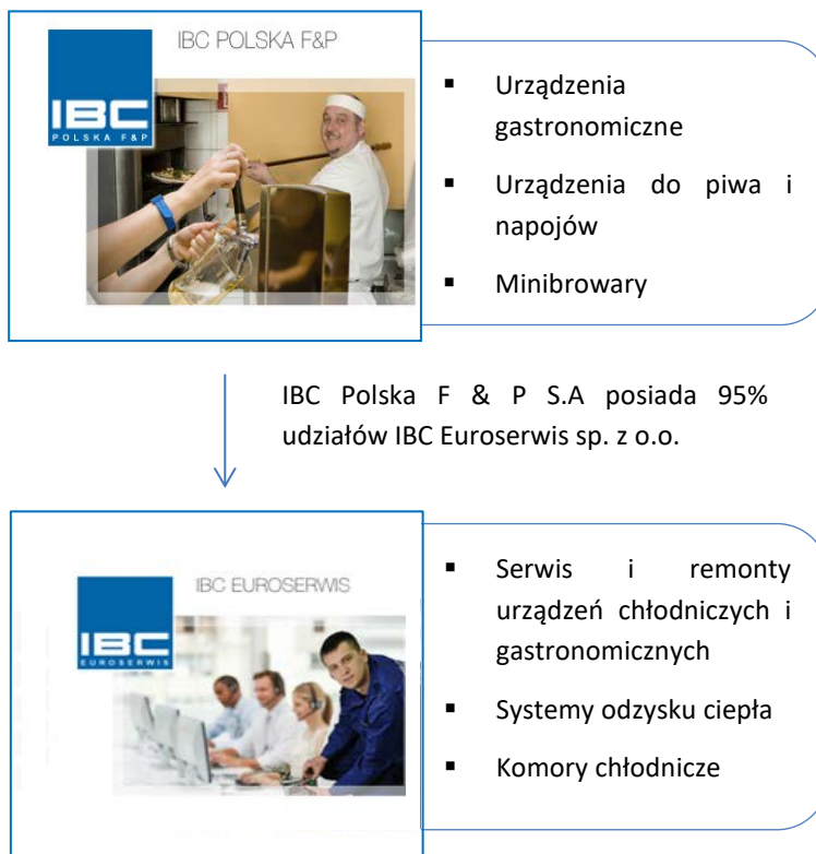
Tabela: Wykaz jednostek wchodzących w skład Grupy Kapitałowej IBC POLSKA F & P S.A.