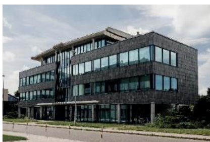
Siedziba AMK Kraków S.A.

Acciona Construcción S.A. jest właścicielem 62,13 % akcji Mostostalu Warszawa S.A. wg stanu na 30.09.2022 rok.