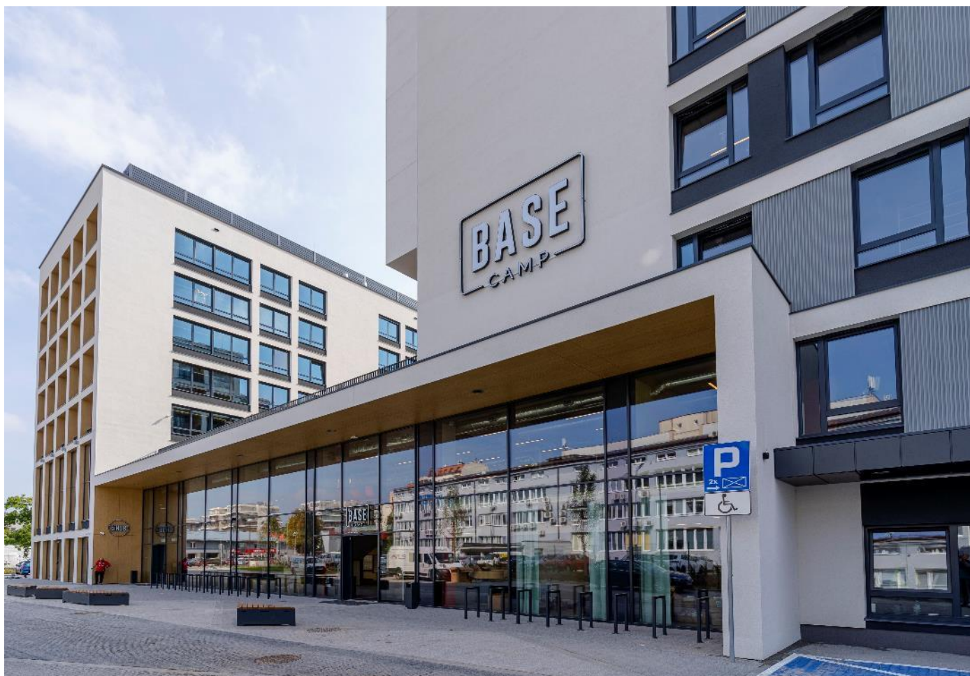
Dom studencki BaseCamp w Katowicach