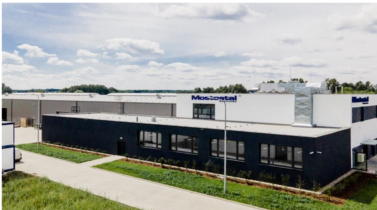
Baza Sprzętowo Transportowa firmy Mostostalu Warszawa w Urzucie

Wartość zobowiązań krótkoterminowych z tytułu dostaw i usług na 30.09.2022 roku wyniosła 190.011 tys. zł.