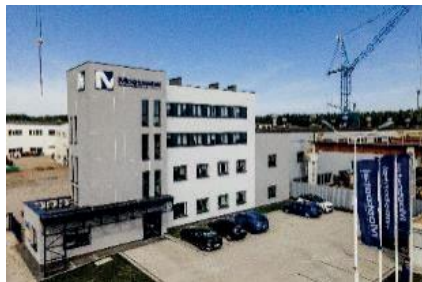
Siedziba Mostostal Kielce S.A.