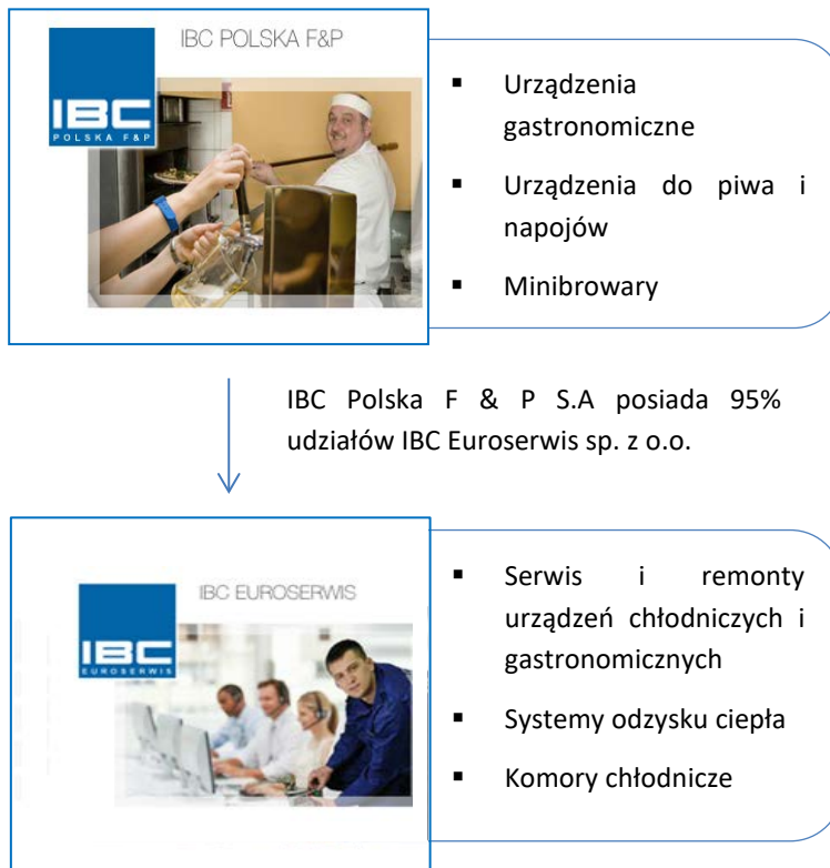
Tabela: Wykaz jednostek wchodzących w skład Grupy Kapitałowej IBC POLSKA F & P S.A.