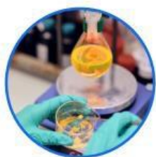
B+R in-house research