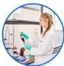
cCRO chemical Contract Research Organization