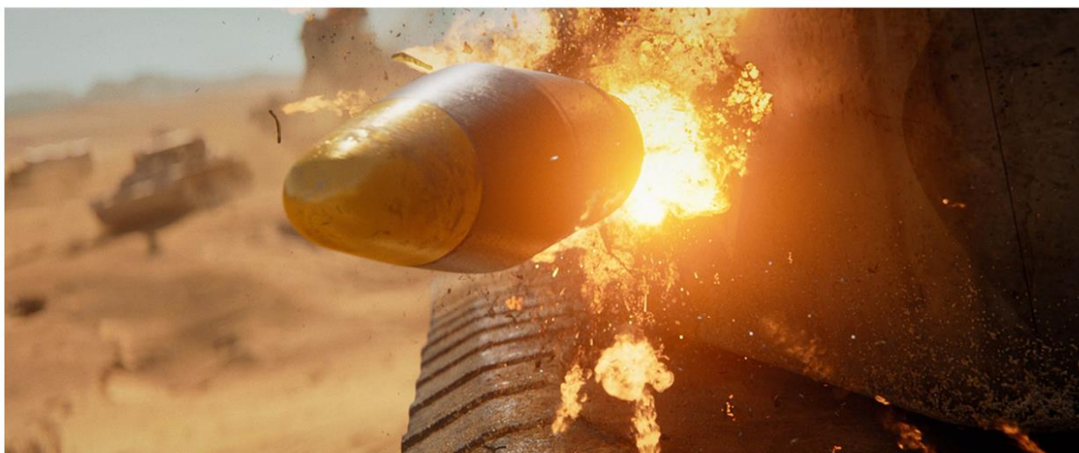
COMPANY OF HEROES 3 | NORTH AFRICA