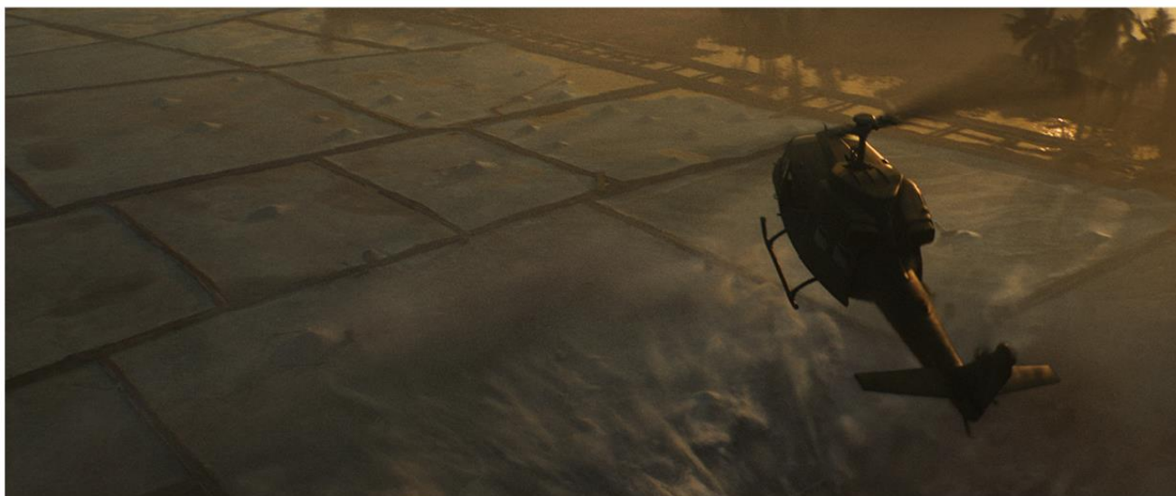
CALL OF DUTY: WARZONE™ | SEASON 5 „LAST STAND”