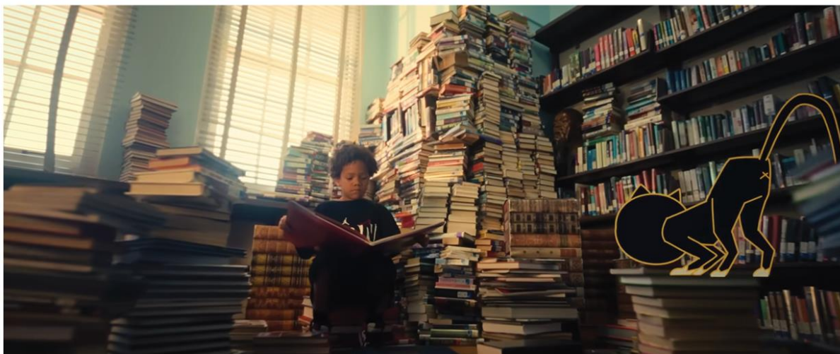
JORDAN BRAND | BACK TO SCHOOL – MOOKIE BETTS AND DEARICA HAMBY