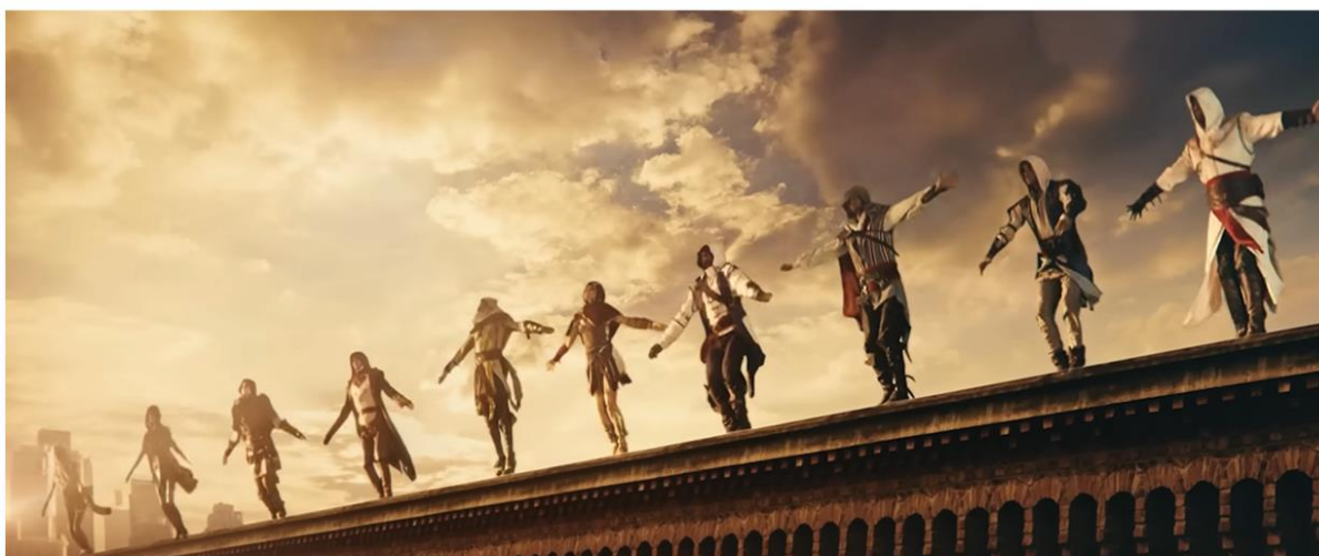
ASSASSIN'S CREED | 15 TH ANNIVERSARY: LEAP INTO HISTORY