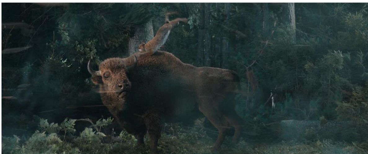
ŻUBR | KTO NIE TRZYMA SIĘ ŻUBRA, TEN...