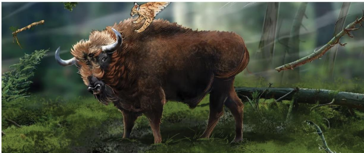
ŻUBR TRĄBA | VFX BREAKDOWN / MAKING OF