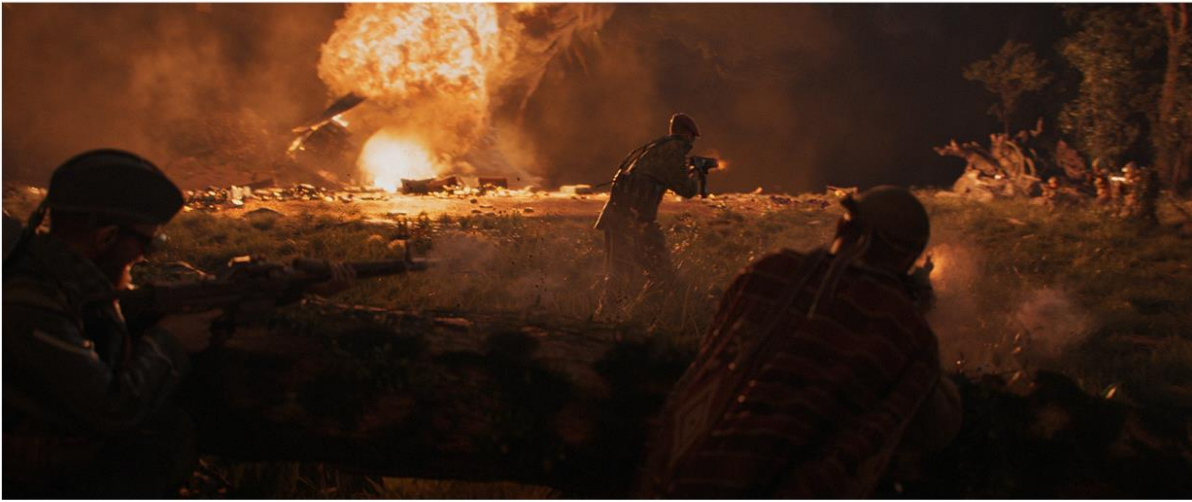
CALL OF DUTY: VANGUARD & WARZONE™ | SEASON 4 „MERCENARIES OF FORTUNE”