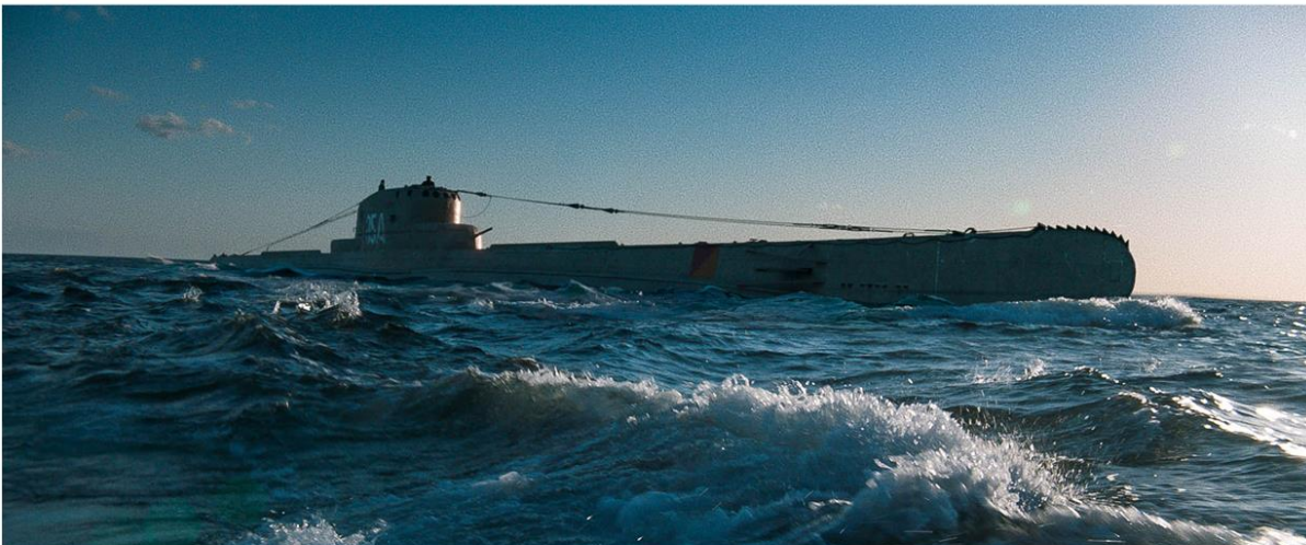
ORZEŁ. OSTATNI PATROL