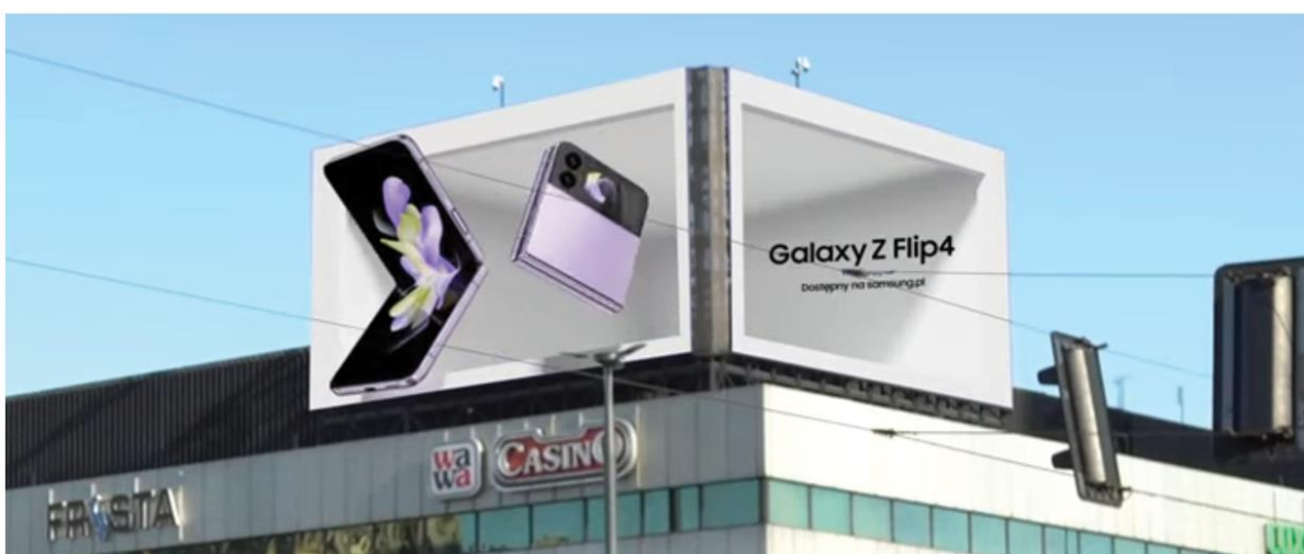
SAMSUNG | GALAXY Z FLIP4