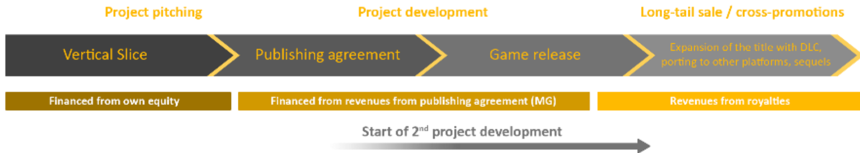
Graf 4. Model biznesowy w Grupie The Dust.

Zgodnie z przyjętymi normami na rynku każda z umów wydawniczych obejmuje: