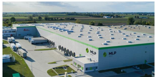
HALA LOGISTYCZNA PRUSZKÓW