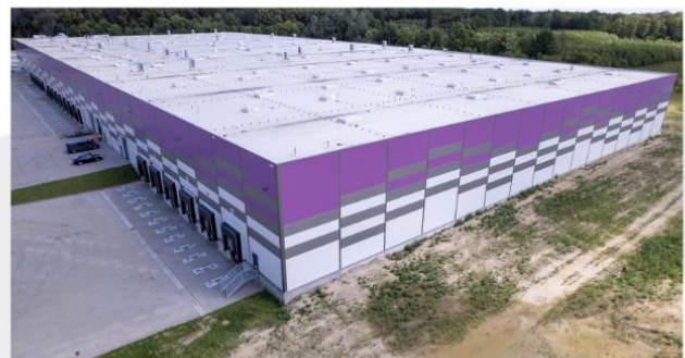
HALA W TERESINIE