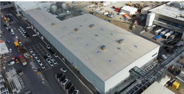
TESLA W BERLINIE