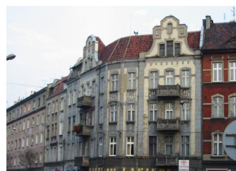
Gliwice ul. Wrocławska 31 i 33. Stan przed i po restrukturyzacji