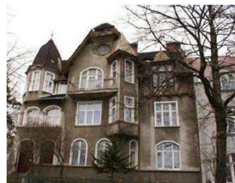
Sopot, ul. Chopina 7. Stan przed i po restrukturyzacji