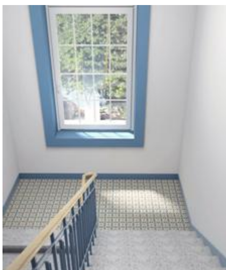
Warszawa, ul. Mińska 14. Stan po rewitalizacji