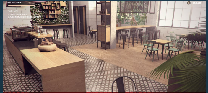
COFFEE BAR RENOVATOR