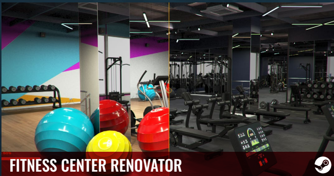
FITNESS CENTER RENOVATOR