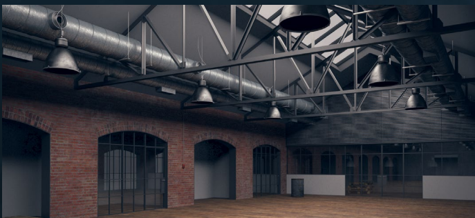
POST INDUSTRIAL RENOVATOR