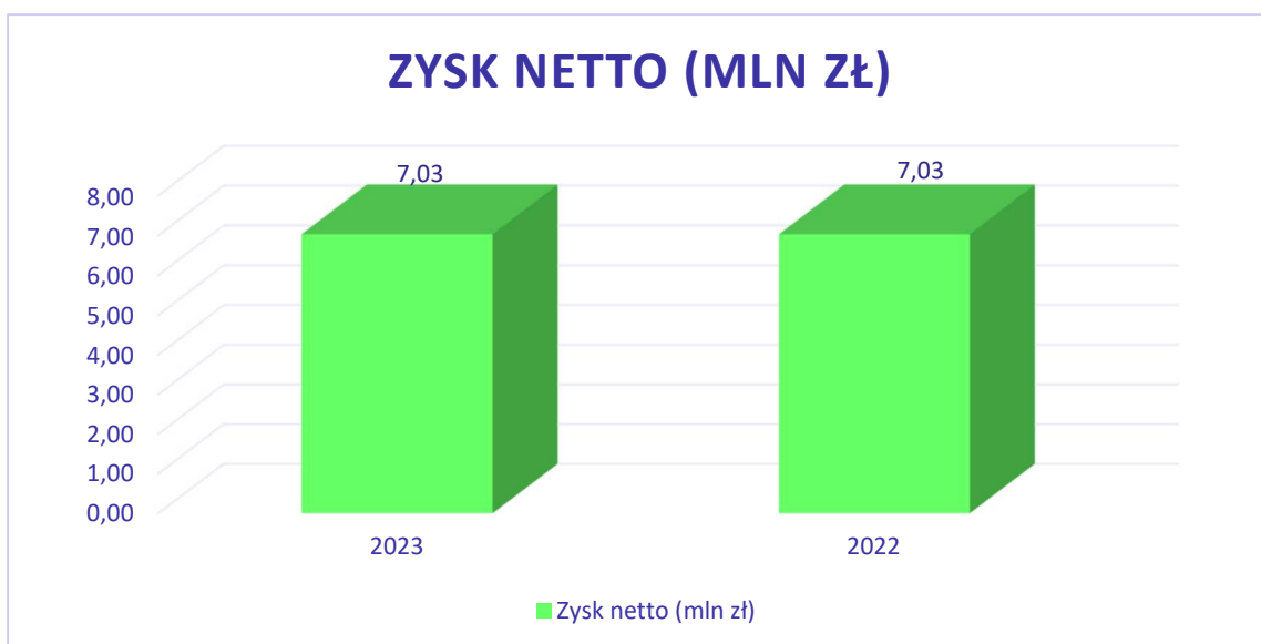
Wykres nr 2: Porównanie zysku netto Prymus S.A. w latach 2023 i 2022.