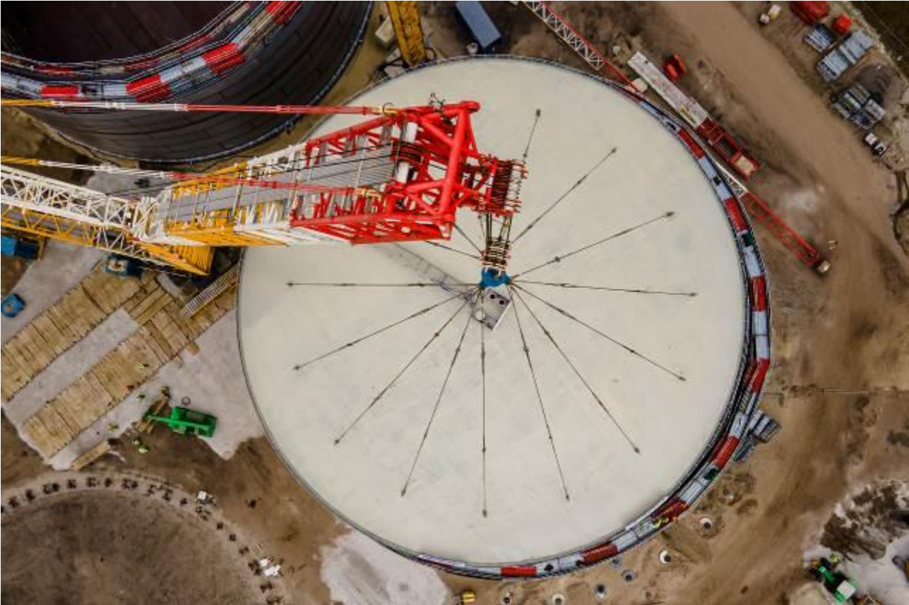
Budowa zbiorników PERN w Nowej Wsi Wielkiej