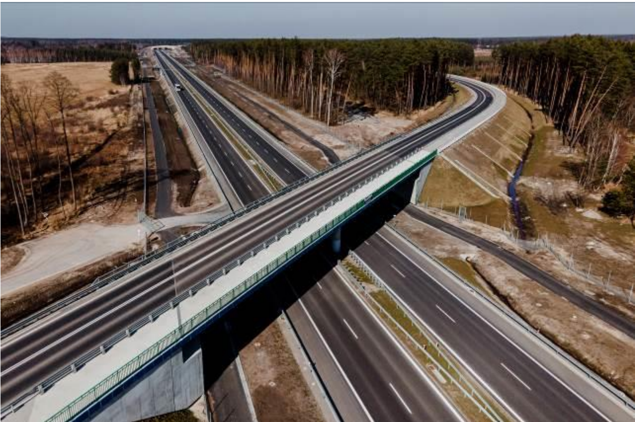
S19 Nisko Południe-Podgórze

W I kwartale 2022 roku nie tworzono odpisów aktualizujących wartość należności, rozwiązano odpisy z tego tytułu w kwocie 1.121 tys. zł.