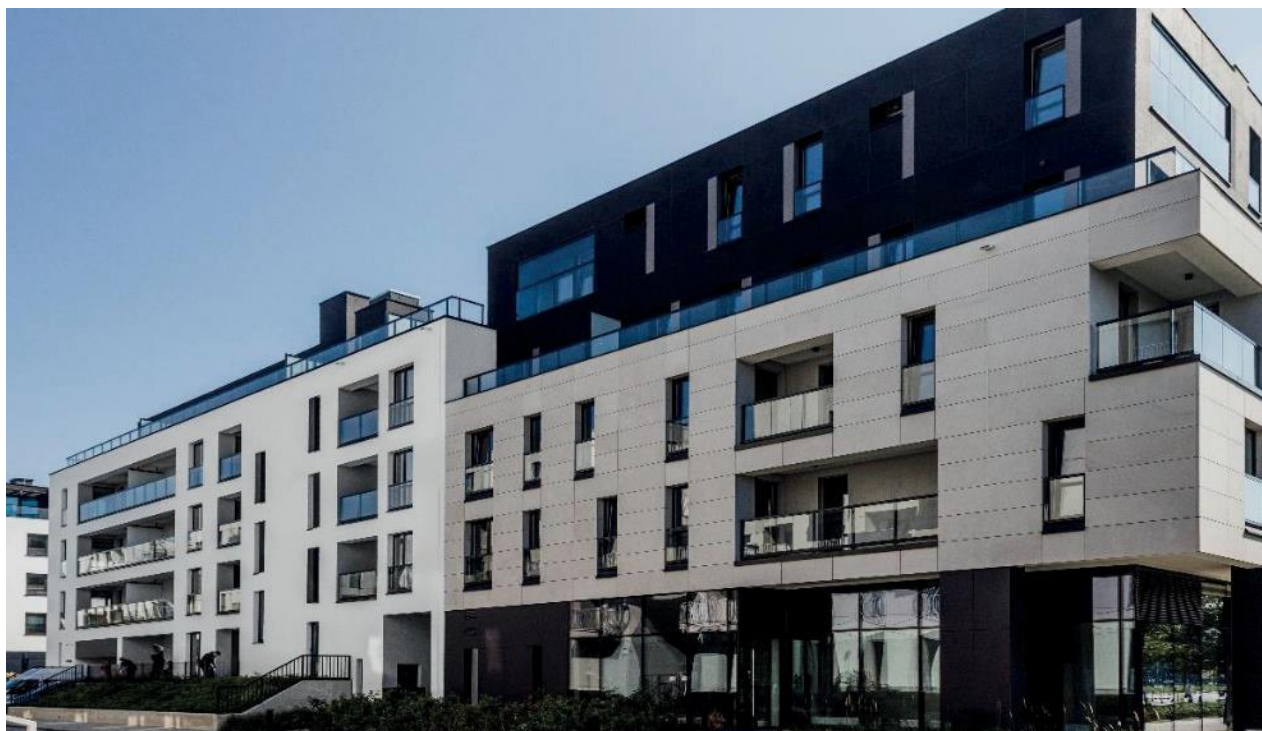
Acciona Wilanów B6

Wartość zobowiązań krótkoterminowych z tytułu dostaw i usług na 31.03.2022 roku wyniosła 215.867 tys. zł i w porównaniu do 31.12.2021 roku zwiększyła się o 24.970 tys. zł.