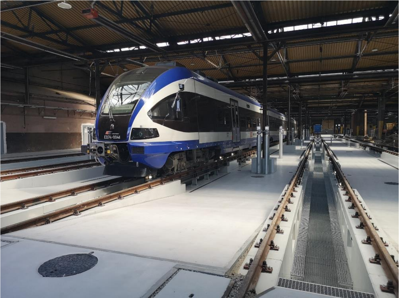
Hala Lokomotywni PKP Intercity we Wrocławiu