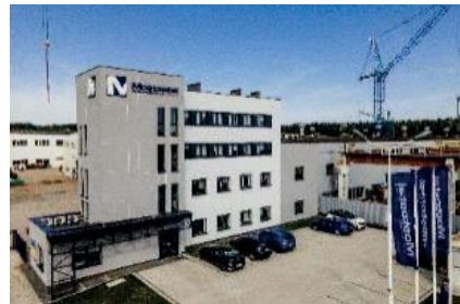
Siedziba Mostostal Kielce S.A