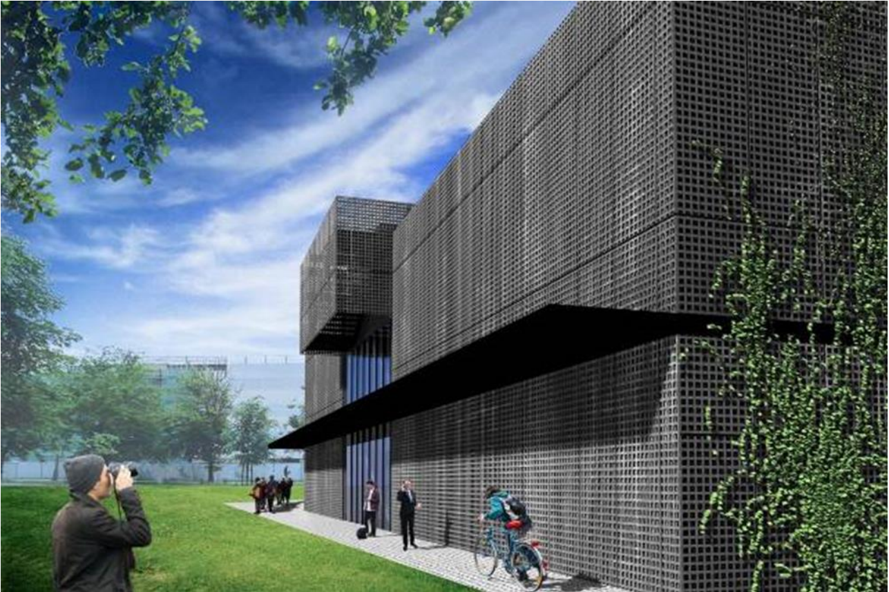
Studenckie Centrum Konstrukcyjne AGH w Krakowie (wizualizacja)