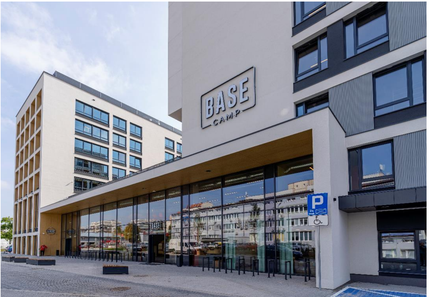
Dom studencki BaseCamp w Katowicach