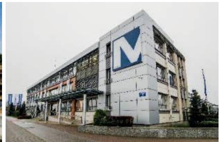
Siedziba Mostostal Płock S.A.