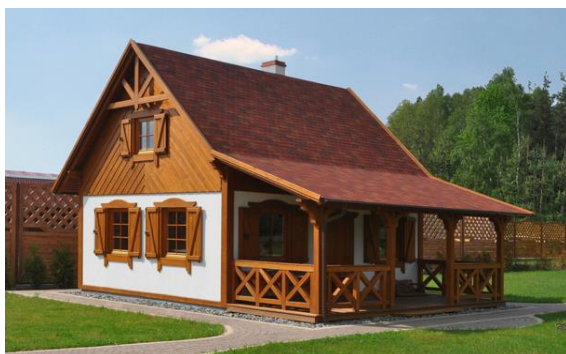
Domy w Sznurkach