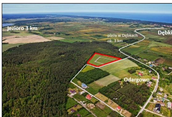
Działki w Odargowie