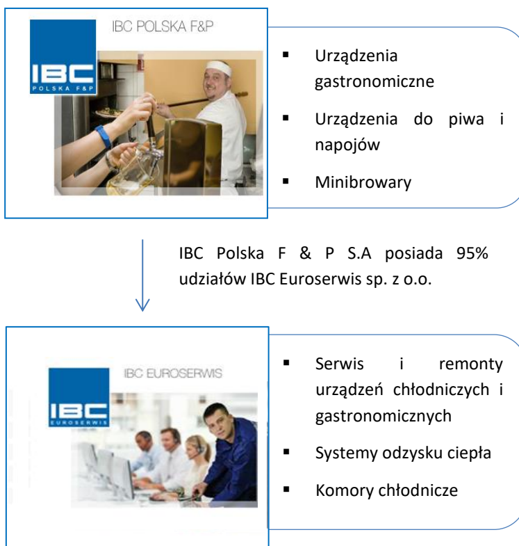
Tabela: Wykaz jednostek wchodzących w skład Grupy Kapitałowej IBC POLSKA F & P S.A.