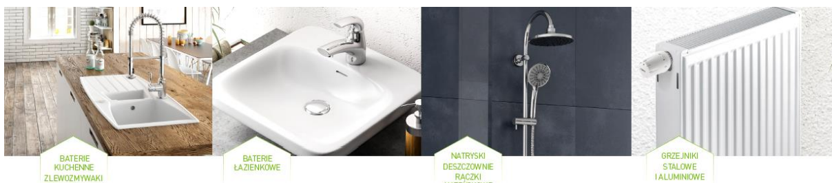
BATERIE KUCHENNE ZLEWOZMYWAKI