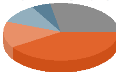
Akcjonariat według liczby akcji