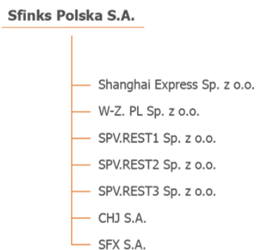
Tab. Struktura Grupy Kapitałowej.

Na dzień 31 marca 2021 r., na dzień 31 marca 2020 r. i na datę sporządzenia niniejszego sprawozdania w skład Grupy Kapitałowej Sfinks Polska wchodziły następujące spółki zależne powiązane kapitałowo: