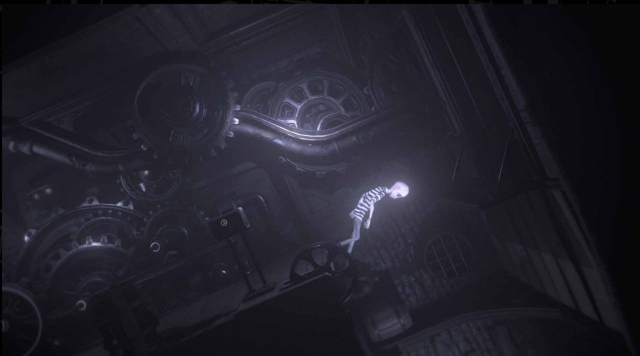
DARQ Complete Edition