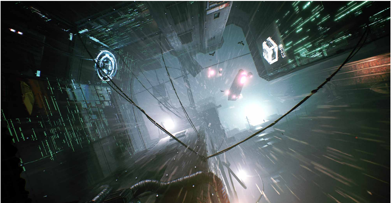
Observer: System Redux