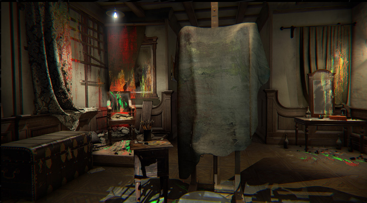
Layers of Fear