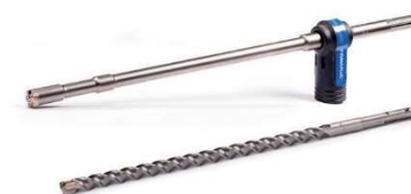
Akcesoria do elektronarzędzi