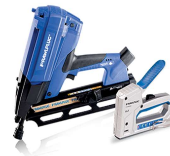
Techniki montażu ręcznego i bezpośredniego