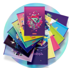
Mix artykułów szkolnych z firmą Herlitz