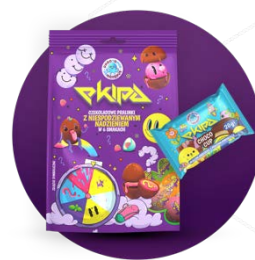
Czekoladki Choco Cup i challenge-owe praliny o sześciu różnych smakach z firmą Millano