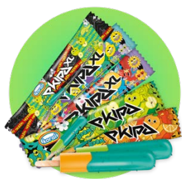
5 smaków lodów z firmą Koral