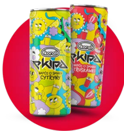
2 smaki napojów z firmą Koral