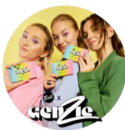
Zestaw kosmetyków do makijażu GenZie z firmą Bell