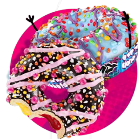
2 smaki donutów z firmą Dotti Donuts