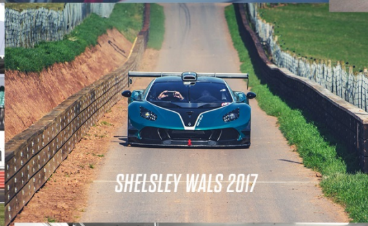
SHELSLEY WALS 2017