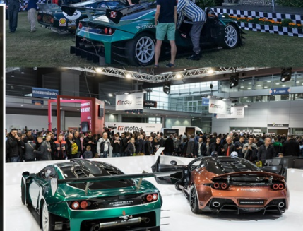
MOTOR SHOW POZNAN 2017