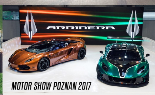
MOTOR SHOW POZNAN 2017