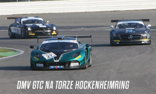
DMV GTC NA TORZE HOCKENHEIMRING