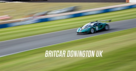
BRITCAR DONINGTON UK