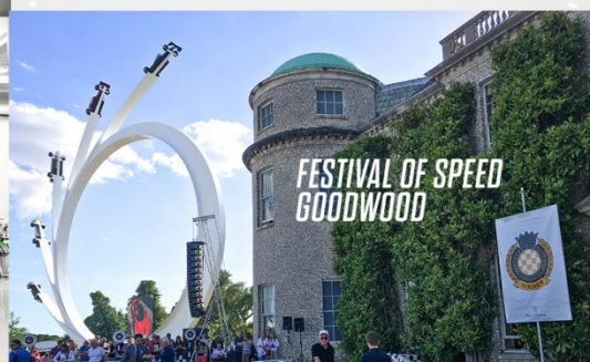
FESTIVAL OF SPEED GOODWOOD