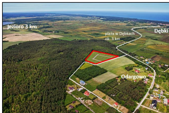
Działki w Odargowie