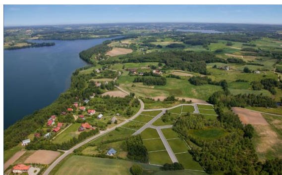
Działki w Sznurkach