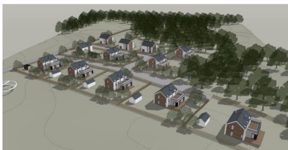
Donimierz – projekt zagospodarowania