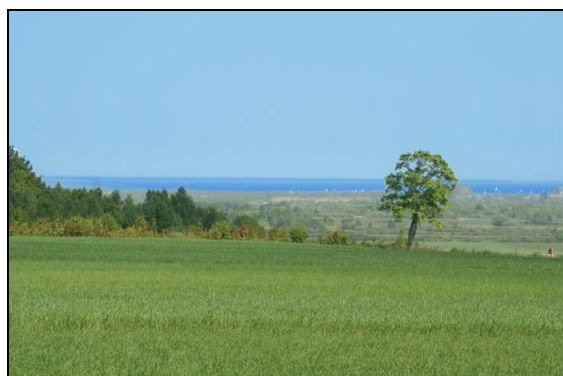
Działki w Zdradzie