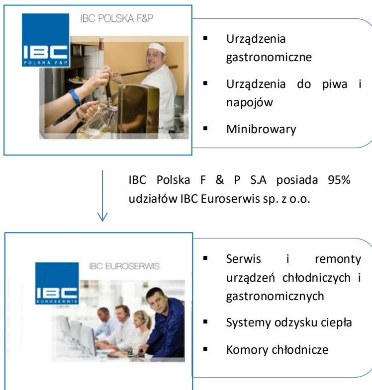
Tabela: Wykaz jednostek wchodzących w skład Grupy Kapitałowej IBC POLSKA F & P S.A.