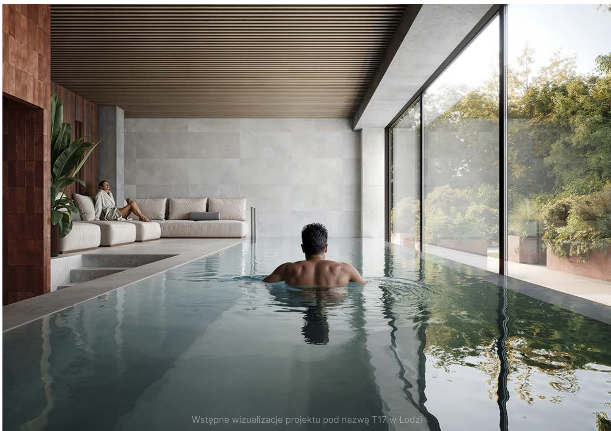
Wstępne wizualizacje projektu pod nazwą T17 w Łodzi