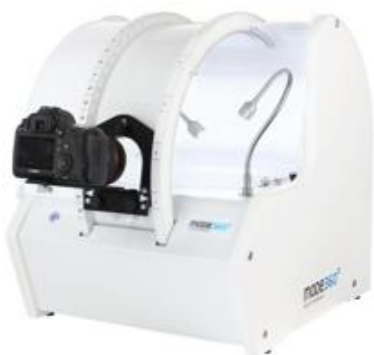
Photo Composer to kompaktowe urządzenie posiadające własne oświetlenie fotograficzne LED, stół bezcieniowy z platformą obrotową do zdjęć 360 stopni oraz ramię do zdjęć sferycznych 3D.

Oferta MODE SA zorientowana jest na rozwiązania do fotografii produktowej, wizualizacji cyfrowej oraz narzędzi do prac konserwatorskich przy ochronie zabytków oraz dla rynku medycznego i kosmetycznego.