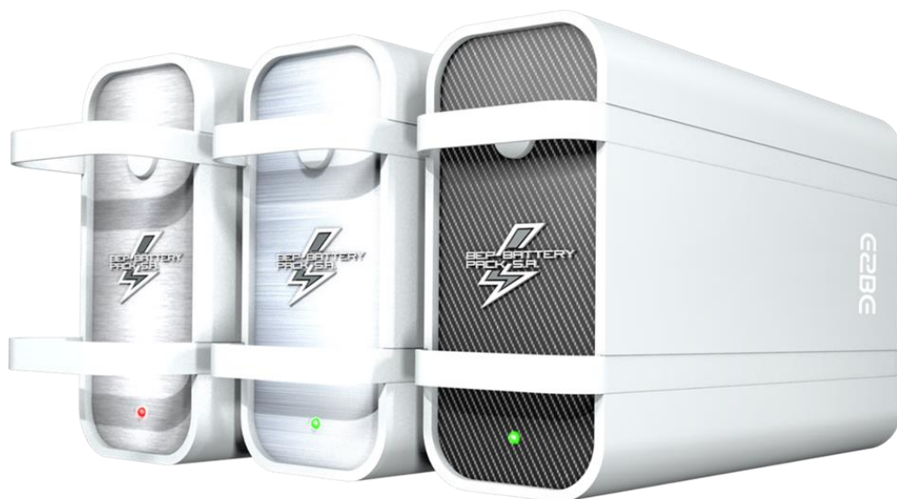
Źródło własne - Biomass Energy Project S.A. Baterie litowe