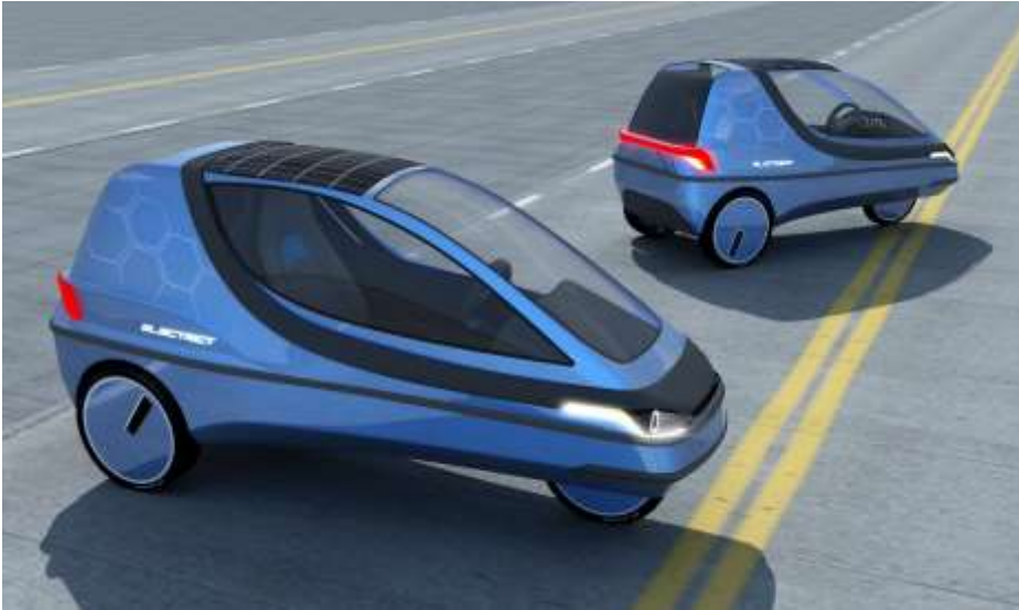
Projekt modernizacji trójkołowego pojazdu elektrycznego dla Hoverjet i Heron Electric