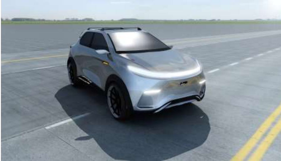
Projekt SUV-a z napędem elektrycznym