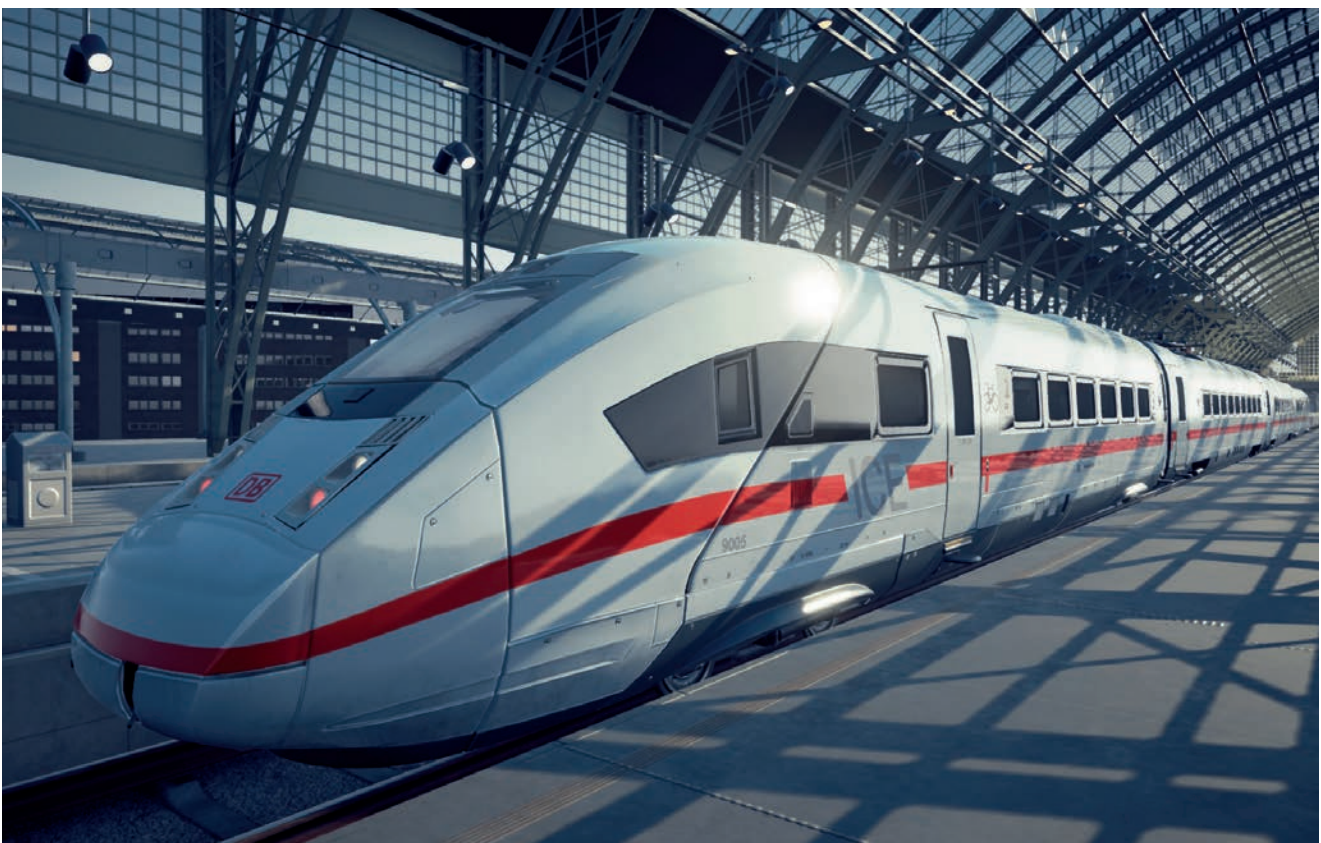
Grafika promocyjna Train Life: A Railway Simulator

Dla Simteract tworzenie realistycznej gry związanej z koleją jest efektem spójnej strategii rozwoju i wykorzystaniem budowanego przez lata know how. W 2016 roku do użytku został oddany profesjonalny symulator pociągu, który zespół Spółki tworzył wraz z globalnym producentem profesjonalnych symulatorów. W latach 2020-2022 natomiast Spółka realizowała projekt badawczo-rozwojowy związany z technologią generowania realistycznych wizualizacji tras kolejowych, na który otrzymała grant w wysokości 3,18 mln zł od Narodowego Centrum Badań i Rozwoju (więcej o projekcie poniżej).