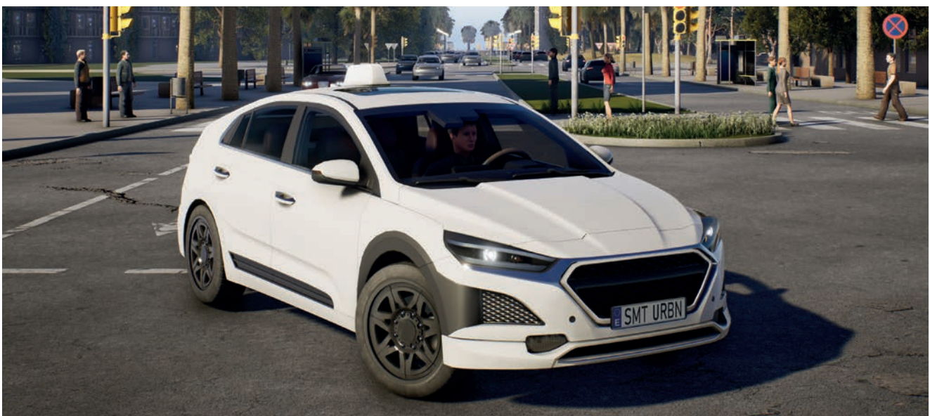
Grafika promocyjna Taxi Life

W I, II i III kwartale 2022 trwały również prace związane z opracowaniem odpowiedniej platformy komunikacyjnej dla gry, co może pozwolić na dotarcie do większej liczby odbiorców. Spółka podpisała umowę marketingową z Evolve PR, agencją wyspecjalizowaną w komunikacji dotyczącej gier wideo. Wraz z Evolve, Spółka przygotowała zapowiedź gry oraz trailer, który został obejrany ponad 60 tys. razy (m.in. na kanale YouTube znanego portalu IGN). Przedstawiciele spółki byli także obecni na targach gier (SXSW, GDC, PAX East czy Gamescom), na których prezentowali projekt graczom.