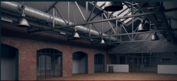
POST INDUSTRIAL RENOVATOR