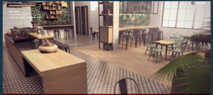
COFFEE BAR RENOVATOR