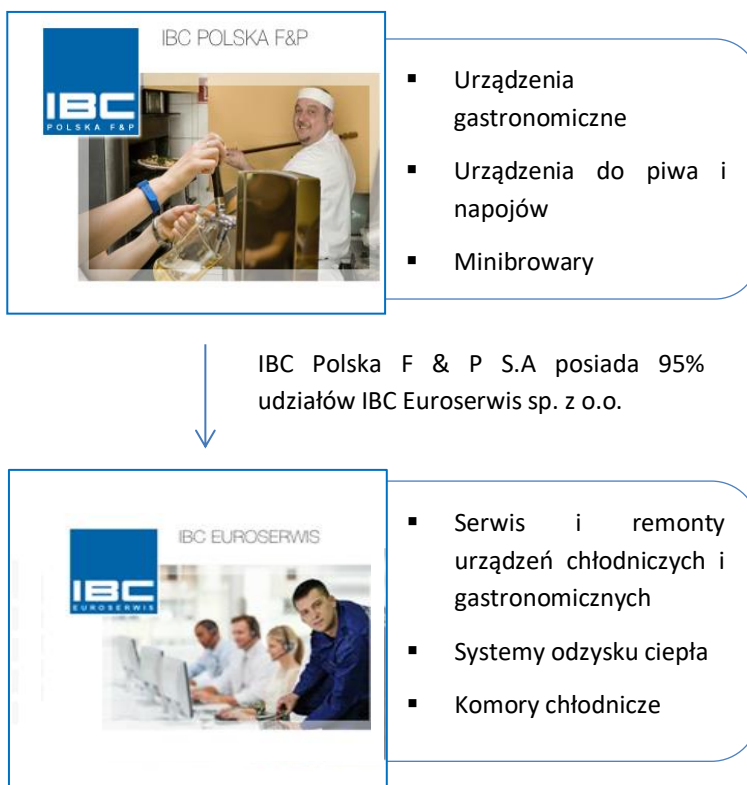
Tabela: Wykaz jednostek wchodzących w skład Grupy Kapitałowej IBC POLSKA F & P S.A.