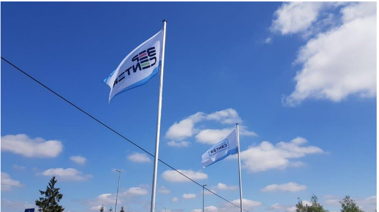
Źródło własne - Biomass Energy