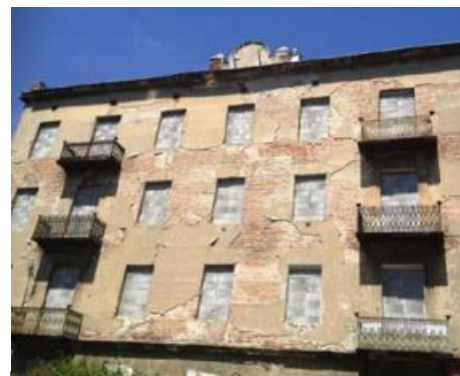
Warszawa, ul. Kamionkowska 41. Stan przed i po restrukturyzacji

Zgodnie z informacjami posiadanymi przez Emitenta, na dzień przekazania raportu akcjonariuszami posiadającymi co najmniej 5% głosów na walnym zgromadzeniu akcjonariuszy 2C Partners są następujące podmioty: