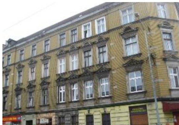
Gliwice, ul. Św. Katarzyny 1. Stan przed i po rewitalizacji