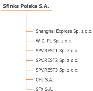
Tab. Struktura Grupy Kapitałowej.

Na dzień 30 czerwca 2021 r., na dzień 30 czerwca 2020 r. i na datę sporządzenia niniejszego sprawozdania w skład Grupy Kapitałowej Sfinks Polska wchodziły następujące spółki zależne powiązane kapitałowo: