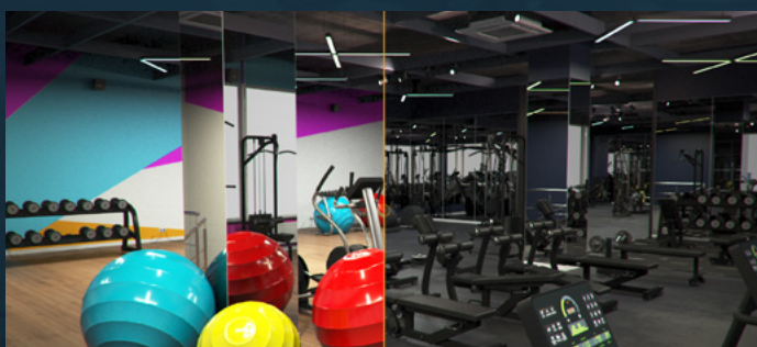
FITNESS CENTER RENOVATOR