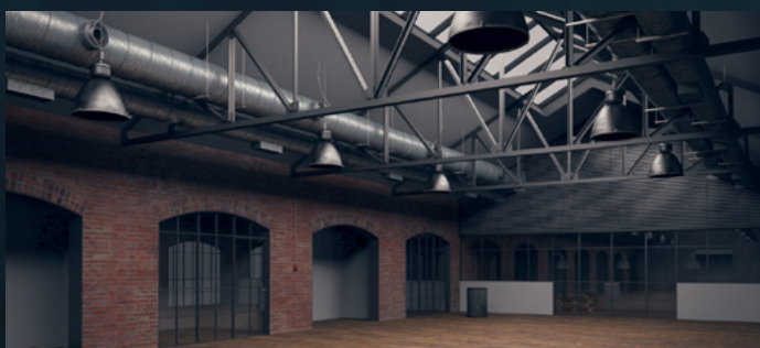
POST INDUSTRIAL RENOVATOR