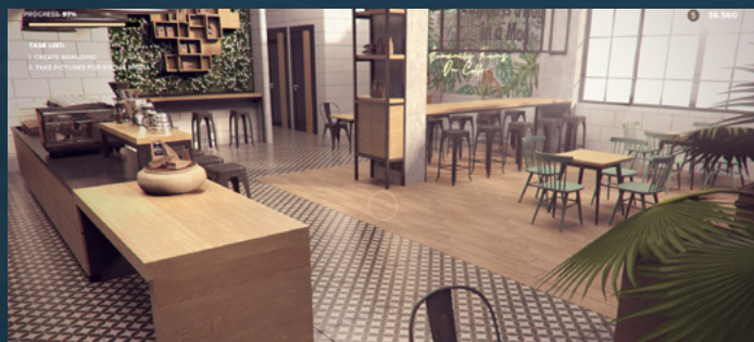
COFFEE BAR RENOVATOR