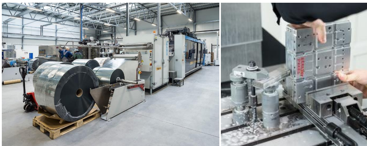
Na zdjęciu: Linia do termoformowania spółki Korporacja KGL S.A.

Przewagi uzyskane dzięki CBR w zakresie know-how mają istotny wpływ na wzrost konkurencyjności Spółki, co z kolei przyczyni się do zwiększenia przychodów, możliwości zoptymalizowania struktury organizacyjnej oraz uniezależnienia się od zewnętrznych dostawców technologii, jako wyniku komercjalizacji prac B+R.