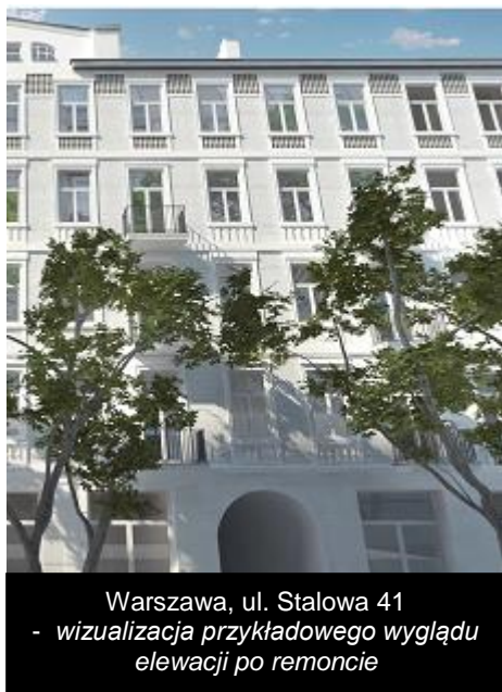
Warszawa, ul. Stalowa 41 - wizualizacja przykładowego wyglądu elewacji po remoncie