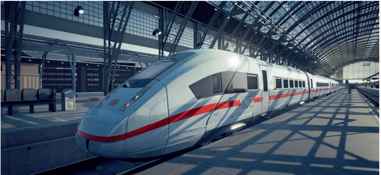
Grafika promocyjna Train Life: A Railway Simulator

Pozostając w tematach kolejowych – rok 2021 to dalsze etapy realizacji projektu badawczo-rozwojowego, na który otrzymaliśmy dotację ok. 3,2 mln zł w ramach programu NCBR Szybka Ścieżka. Efekty tego programu pozwolą nam jeszcze efektywniej generować wirtualne światy – w tym wypadku świat kolejowy.