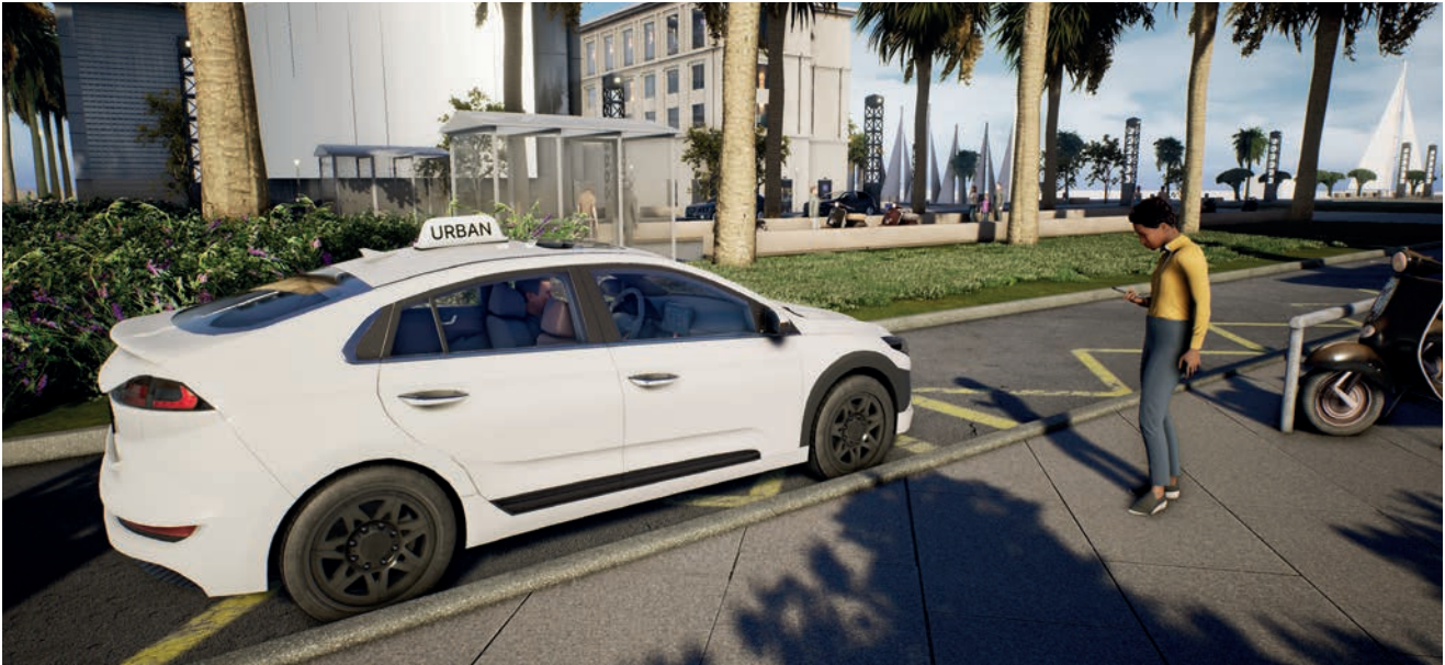
Grafika promocyjna Urban Venture

To życie tchnęliśmy też w grę Urban Venture , nasz symulator transportu samochodowego w pięknej Barcelonie. Wybraliśmy to miasto ze względu na świeżość, piękną architekturę i świetną siatkę dróg, która idealnie pasuje do naszego gameplay'u. Tworząc Urban Venture wykorzystujemy najlepsze praktyki, rozbudowujemy stworzone technologie i łączymy je w grywalnym świecie tego hiszpańskiego miasta. Nasze technologiczne kompetencje łączą się w tej grze na niespotykaną skalę – wykorzystujemy w niej Traffic AI, generujemy miasta i pełne budynki 3D, a wszystko po to aby stworzyć jeszcze bardziej angażującą rozgrywkę, która zadowoli graczy.