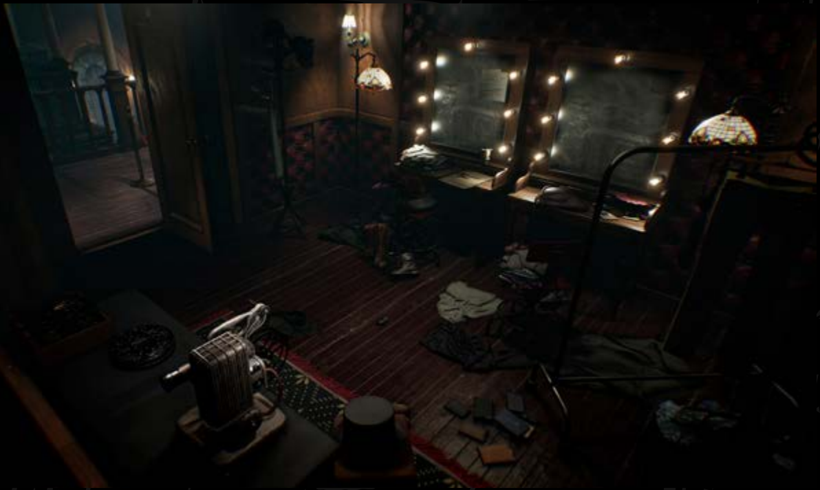
Layers of Fear 2