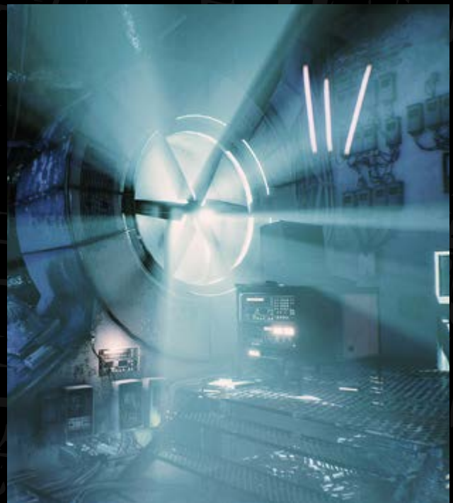
Observer System Redoux