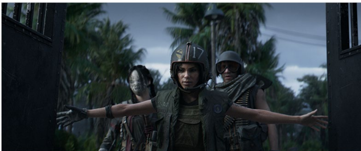
CALL OF DUTY: VANGUARD & WARZONE™ | SEASON 3