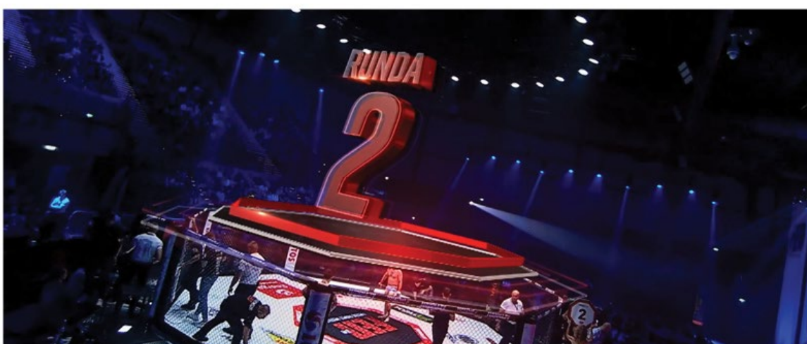
FEN | GALA

Gala FEN38 odbyła się w hali sportowej w Ostrowcu Wielkopolskim. Studio Platige Image wspólnie z Telewizją Polsat zrealizowało transmisję tego wydarzenia. Wkładem działu Events & Broadcast były spektakularne grafiki AR, które górowały nad oktagonem. Zaprezentowano je z kranu kamerowego, dzięki czemu idealnie wpasowały się do przestrzeni hali.