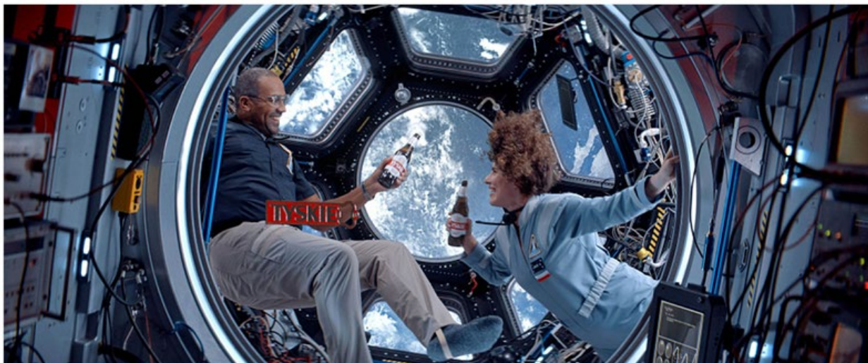
TYSKIE | WKRÓTCE BĘDZIEMY BLIŻEJ