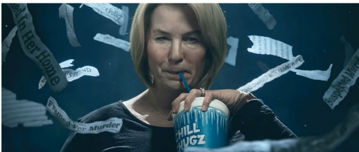
THE THING ABOUT PAM | TEASER TRAILER