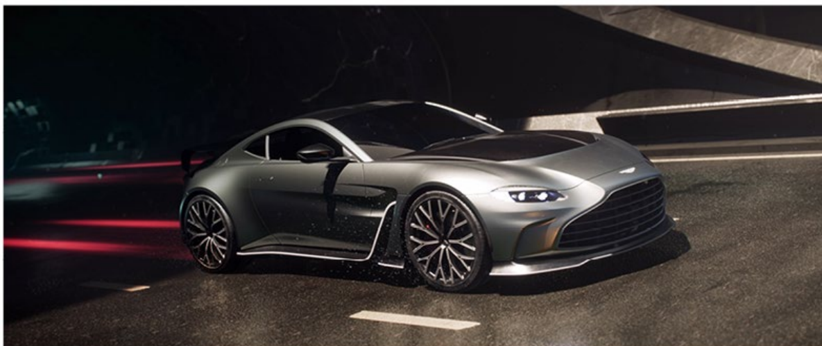
ASTON MARTIN | NEVER LEAVE QUIETLY