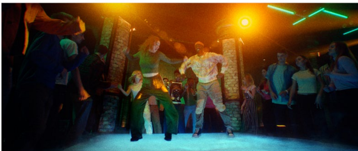
JÄGERMEISTER | DANCERS