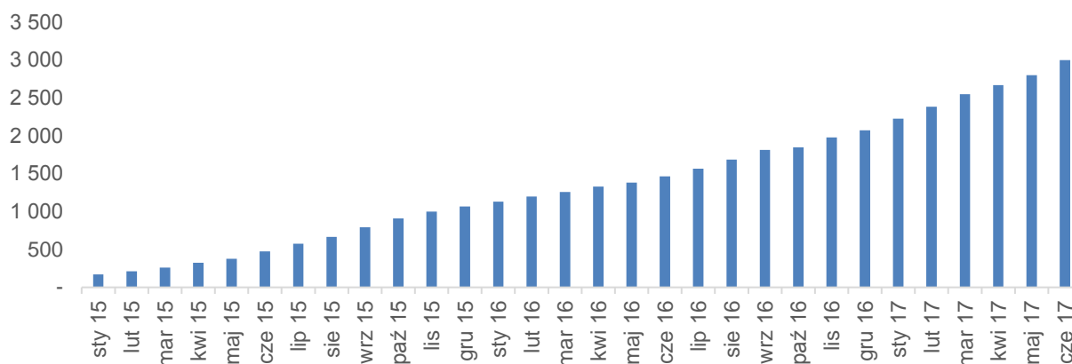
Rys. 1 Dynamika przyrostu Klientów abonamentowych na usługi oferowane przez Emitenta od stycznia 2015 r.

Na koniec czerwca 2017 r. liczba abonentów wyniosła 3.000, przy czym w II kwartale 2017 r. Spółka pozyskała 451 nowych Klientów netto (po uwzględnieniu rezygnacji). Średnia roczna wartość pakietu ofertowego na budowę i utrzymanie obecności firmy w Internecie sprzedanego w II kwartale wyniosła 3.363 PLN. Łączna wartość umów podpisanych z klientami w raportowanym okresie wyniosła około 1 765 tysięcy PLN. Na koniec II kwartału 2017 r. liczba sprzedawców wyniosła 34 osoby.