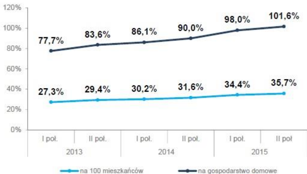
Wykres 1. Wskaźniki nasycenia Internetu szerokopasmowego