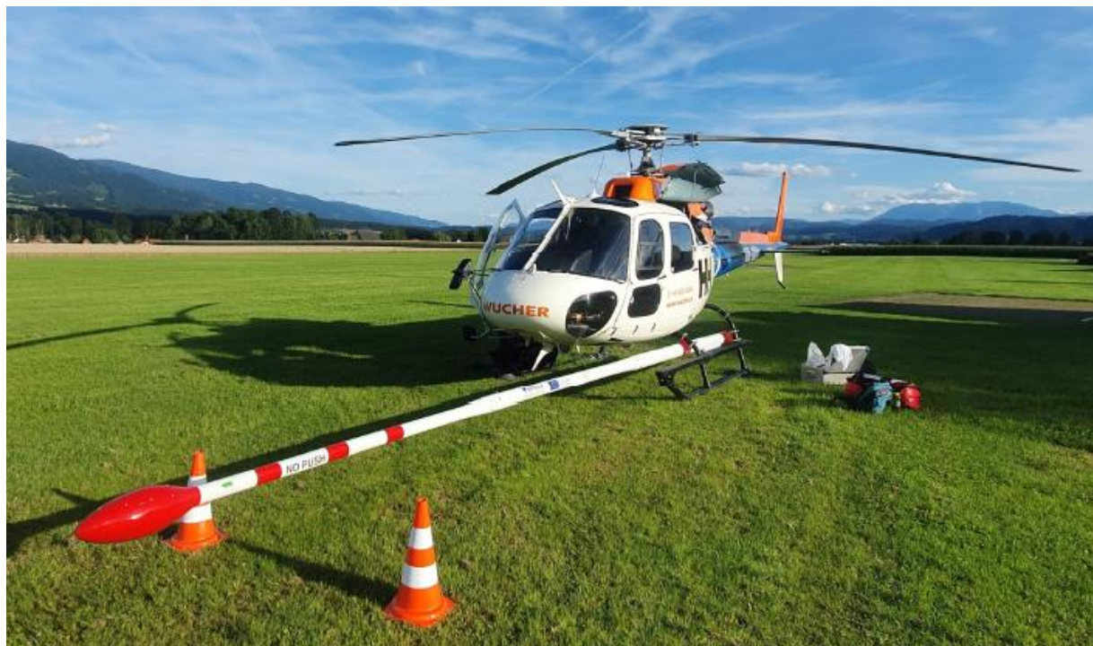
Rys. 2: Konfiguracja śmigłowca z wysięgnikiem dziobowym do badań magnetycznych i radiometrycznych.

zostać zakończone w ciągu jednego tygodnia. Analiza danych geofizycznych rozpocznie się po zakończeniu pomiarów lotniczych i przetworzeniu danych przez wykonawcę.