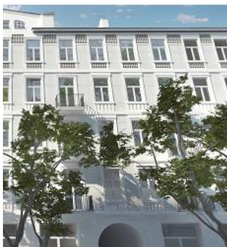
Warszawa, ul. Stalowa 41 - wizualizacja przykładowego wyglądu elewacji po remoncie