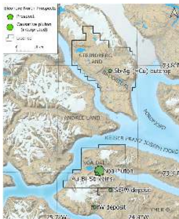
Rys. 3: Mapa przedstawiająca obiekty eksploracyjne i utwory geologiczne na obszarze koncesji Eleonore North.