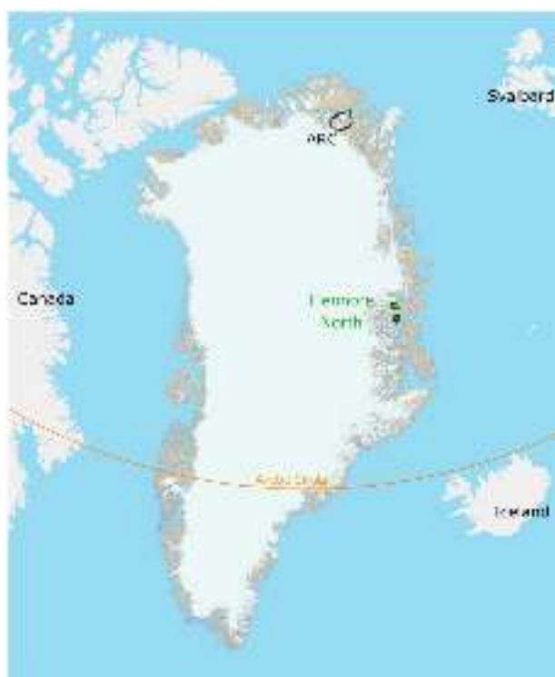
Rys. 2: Mapa Grenlandii przedstawiająca obszary koncesyjne GreenX dla projektów ARC i Eleonore North.

Głównym celem w Eleonore North jest Noa Pluton, a następnie obiekt eksploracyjny Holmesø i jego intruzja źródłowa. Żyły w Noa staną się celem odwiertów w najbliższym czasie, jednak Spółka planuje dokładniej określić głębokość intruzji za pomocą pasywnych badań sejsmicznych. Informacje te potwierdzą interpretację magnetyczną, dadzą większą pewność dla przyszłego programu wierceń i pomogą określić wielkość intruzji w obrębie dobrze zdefiniowanych hornfelsów.