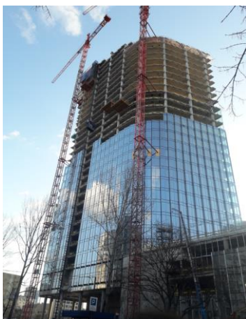
Budynek biurowo – mieszkalny MENNICA