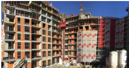
Budynek mieszkalny CITY LINK w Warszawie