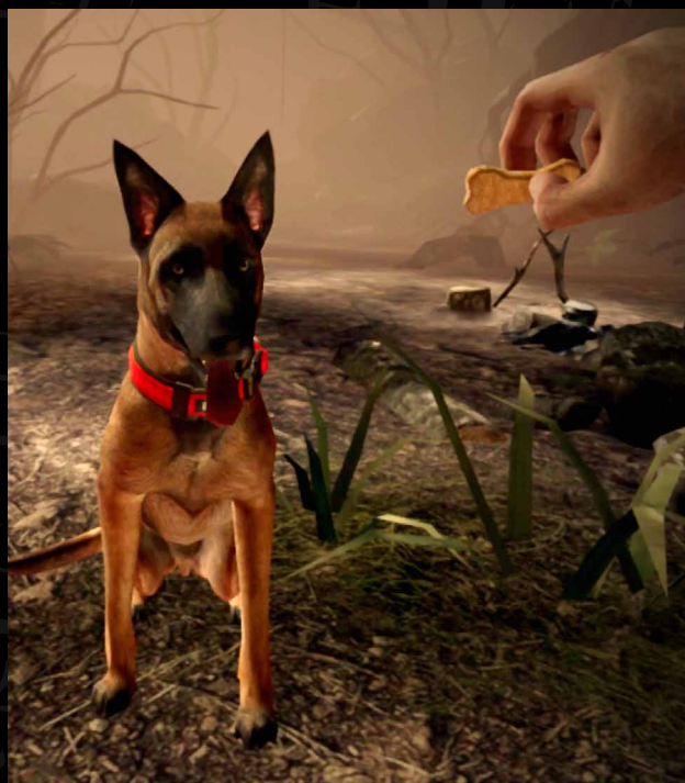
Blair Witch Quest Edition