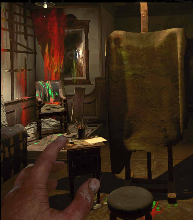
Layers of Fear VR