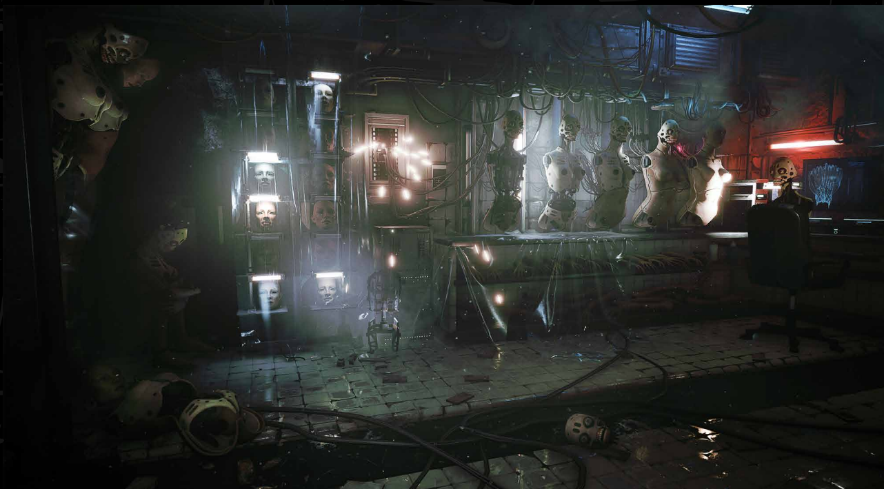
Observer System Redux