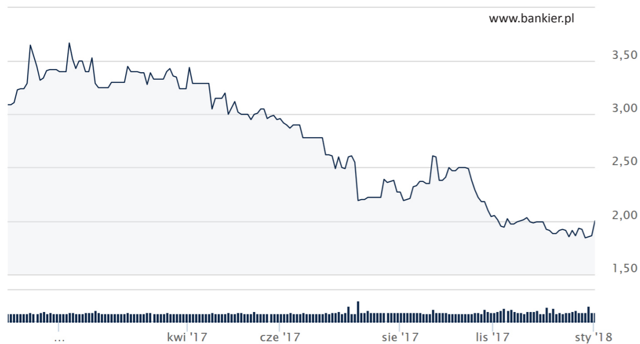
Wykres notowań akcji Ekopolu Górnośląskiego Holding SA w 2017 roku

Spółka zadebiutowała na rynku akcji GPW NewConnect 27 sierpnia 2008 r. pozyskując w wyniku oferty prywatnej 1,78 mln zł przy konieczności poniesienia kosztów w wysokości 190 tys zł. Zgromadzony kapitał został przeznaczony na dokończenie budowy budynku administracyjno-biurowego oraz dofinansowanie inwestycji w wydziałach produkcyjnych.