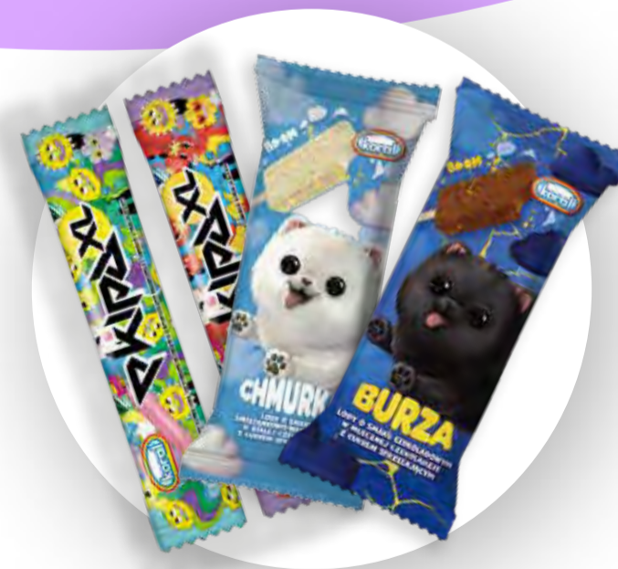
7 smaków lodów z firmą Koral