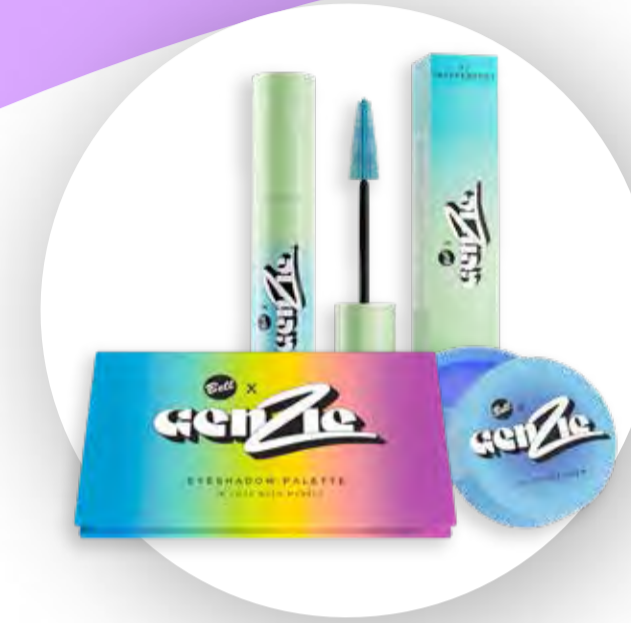
Zestaw kosmetyków do makijażu GenZie z firmą Bell