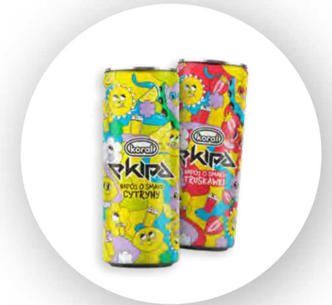
2 smaki napojów z firmą Koral