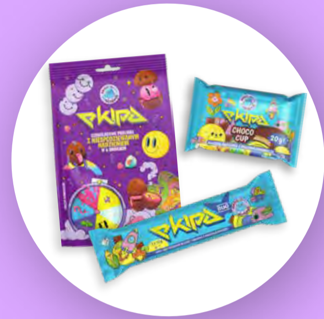
Czekoladowe Choco Cup'y, Batoniki i challenge-owe praliny o sześciu smakach z firmą Milano