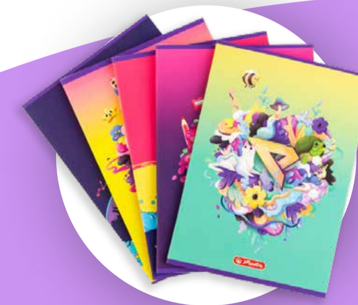
Mix artykułów szkolnych z firmą Herlitz