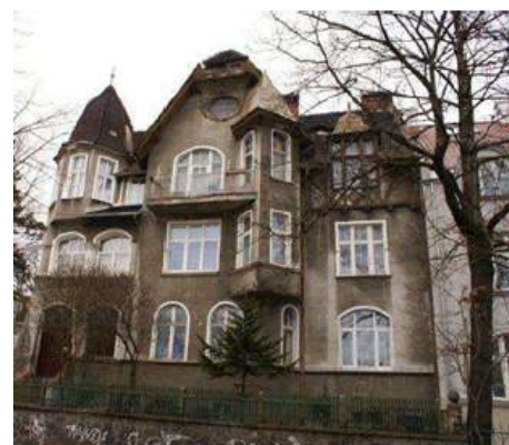
Sopot, ul. Chopina 7. Stan przed i po restrukturyzacji