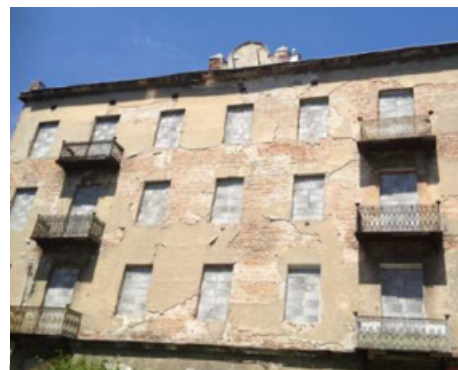
Warszawa, ul. Kamionkowska 41. Stan przed i po restrukturyzacji

Zgodnie z informacjami posiadanymi przez Emitenta, na dzień przekazania raportu akcjonariuszami posiadającymi co najmniej 5% głosów na walnym zgromadzeniu akcjonariuszy 2C Partners są następujące podmioty: